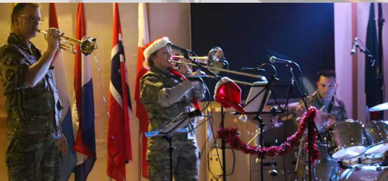
SMUK har flere gange underholdt udsendte danske soldater bl.a. i Kabul, Afghanistan

Børnemedaljen gives til, børn, som har været berørt af et nært familiemedlems udsendelse.