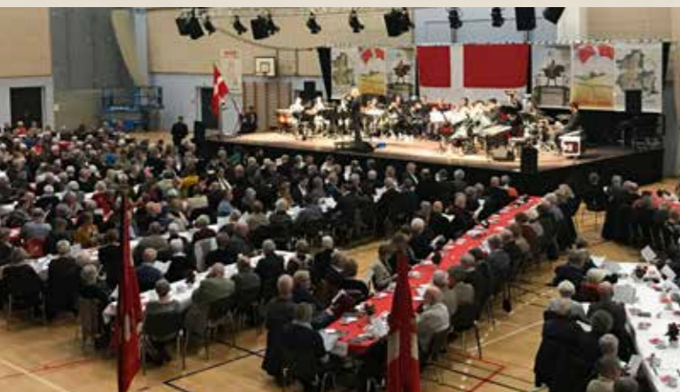
Afstemningsfesten var arrangeret af Udvalget for nationale mindesamvær, Grænseforeningen for Kolding og omegn, Kolding Kommune og Foreningen Norden.

Det havde summet længe op til, og blandt andre dronningen nævnte den i sin nytårstale. Mandag den 10. februar lød startskuddet imidlertid for markeringen af 100-året for Genforeningen. Det skete i forbindelse med, at en stribe sønderjyske byer traditionen tro inviterede til afstemningsfest. SMUK var på plads ved festen i Cuben i Christiansfeld og var her med til at skabe den helt rigtige stemning til festen, hvor der var kaffe, kage, taler og fællessang.