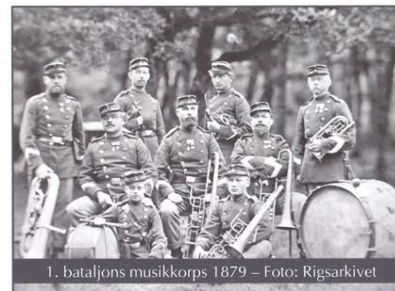
1. bataljons musikkorps 1879

farvestrålende musikkorps som muligt. Ofte betalte regimentets officerer af egen lomme til musikkorpsset. Men i 1842 blev alle infanteriregimenterne nedlagt og bataljonerne blev gjort til taktiske enheder, formerede i 4 brigader. På den måde forsvandt alle regimentsmusikkorpsene, og en ny organisation af militærmusikken i hæren blev opbygget. Resultatet blev 4 brigademusikkorps på hver 26 musikere. Alle disse 4 musikkorps havde harmonibesætning - altså såvel træblæsere (klarinet, obo, fløjter, fagot) som messingblæsere (trompet, horn, basun og tuba).