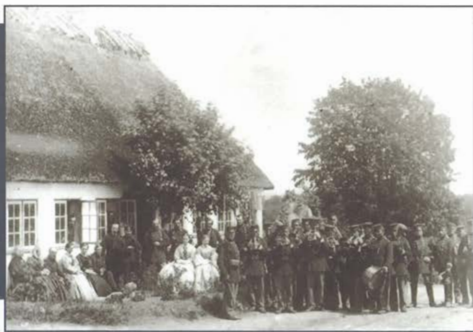
5. Bataljon nu som 5. Regiments Musikkorps på Fyn 1864. Fra december 1863 til efter krigen om-dannedes linieinfanteribataljonerne til regiment.

Efter krigen blev et ikke ringe antal af disse brave mænd hædret med Dannebrogsmændenes Hæderstegn for udvist mandsmod, da det gjaldt "Holstenerne", der loyalt stod last og brast med deres danske regiment, gik i stort tal efter overgivelsen med deres korps til Danmark, trods det faktum at mange havde familie og venner i det gamle land, de nu rømmede.