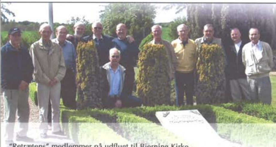
”Retrætens” medlemmer på udflugt til Bjerning Kirke.

Der er ingen vedtægter, love eller lign. Dog høres det, at man kan idømmes en såkaldt ”mulkt” hvis man overtræder en lang række uskrevne regler. Denne ”mulkt” skulle efter sigende bidrage til den gode stemning under ”Retrætens” møder.