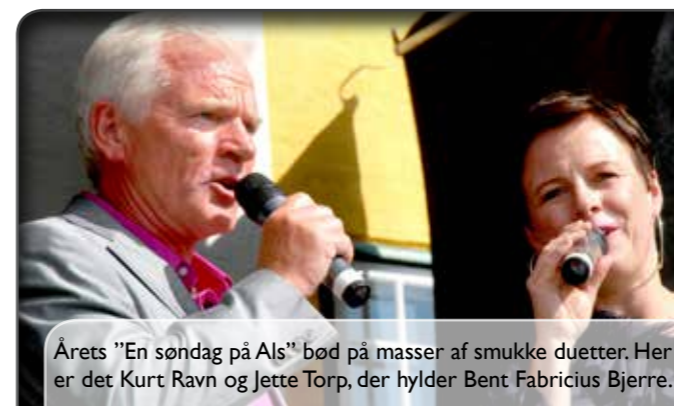
Årets "En søndag på Als" bød på masser af smukke duetter. Her er det Kurt Ravn og Jette Torp, der hylder Bent Fabricius Bjerre.