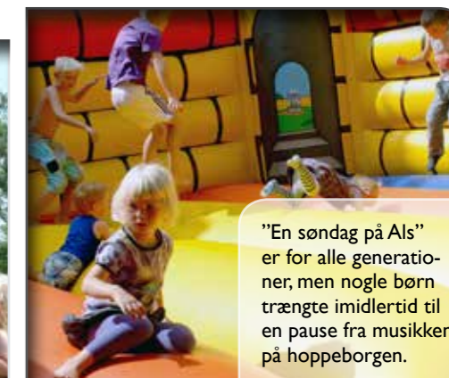
"En søndag på Als" er for alle generationer, men nogle børn trængte imidlertid til en pause fra musikken på hoppeborgen.