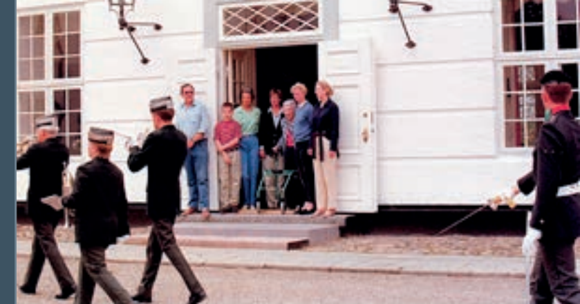
Dronning Ingrid henvendte sig af og til SMUK – Slesvigsk Musikkorps, når de som her spillede på Gråsten Slot.