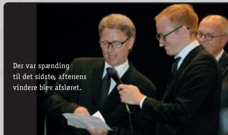
Der var spænding til det sidste, aftenens vindere blev afsløret.