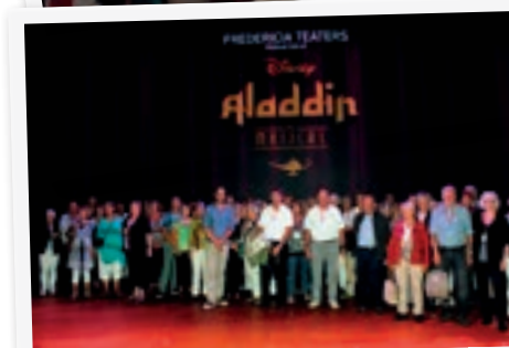
De 92 medlemmer af Støtteforeningen, der var på tur, fik taget gruppebillede foran bagtappet til den store Aladdinforestilling i Operaen.