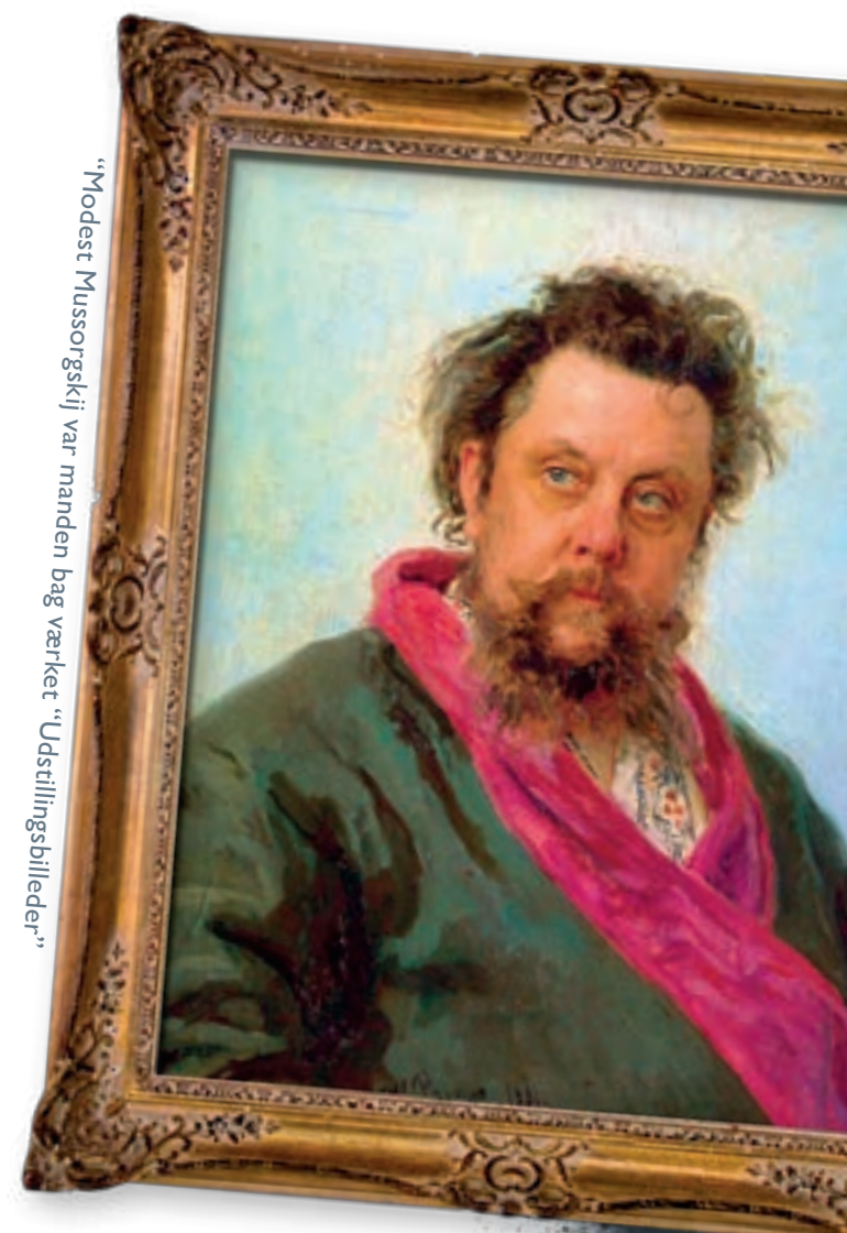
"Modest Mussorgskij var manden bag værket 'Udstillingsbilleder'."