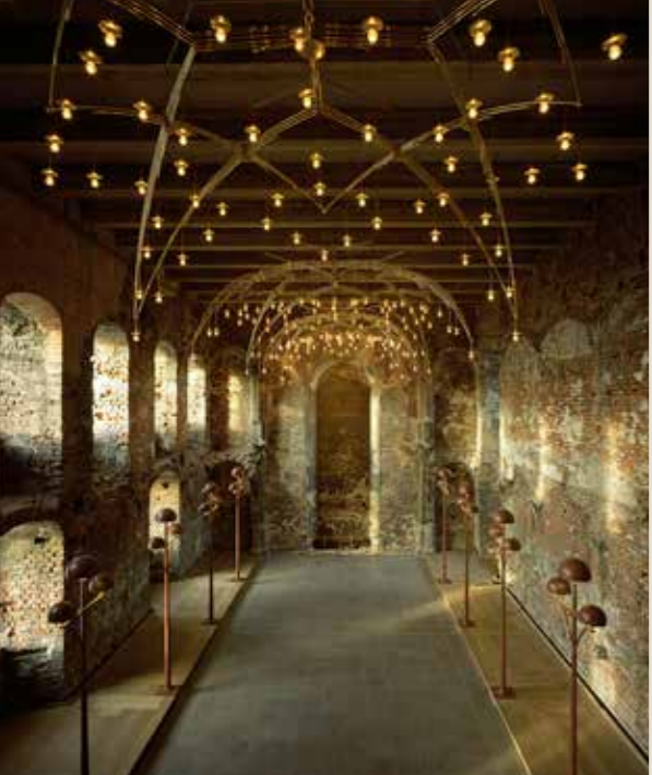
(Kongernes Samling) Kirkesalen